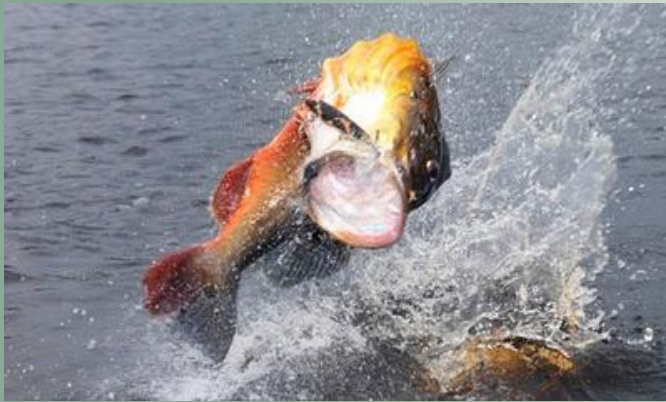
Holley et al., 2008 1 ; Freitas & Rivas, 2006 2 ;

➤ Médio rio Negro e seus afluentes, destacando-se os rios Jurubaxi, Aracá, Demeni, Cuiuni, Caurés, Padauari e Unini. 2